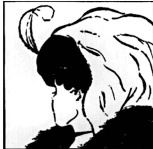
Old woman or young lady?